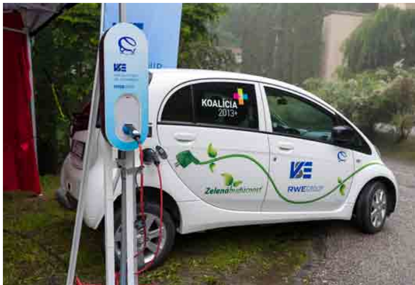
VSE podporuje e-mobilitu aj vo vidieckych lokalitách.

Kúpele plánujú zakúpiť aj elektrické autá a ešte tento rok bude z Košíc