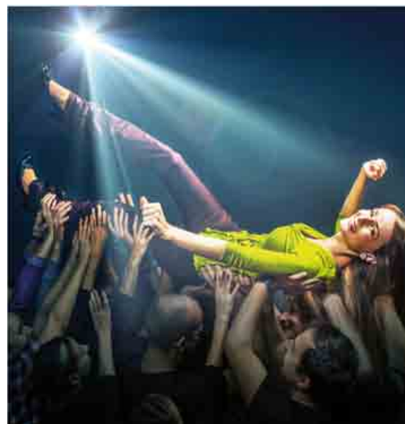
VÚB banka vyzdvihuje zamestnancov, ktorí sa angažujú pre komunitu.

Ocenenie Skrytý hrdina bolo spojené s finančnou odmenou v hodnote 5 000 eur za 1. miesto, 3 000 eur za 2. miesto a 2 000 eur za 3. miesto. Tri ocenené zamestnankyne venovali tento grant na verejnoprospešný účel, resp. organizácii, ktorej svojou dobrovoľníckou prácou pomáhajú. Financie putovali do DSS Lepší svet, Dobrovoľníckej skupiny Vírba a do Slovenského zväzu