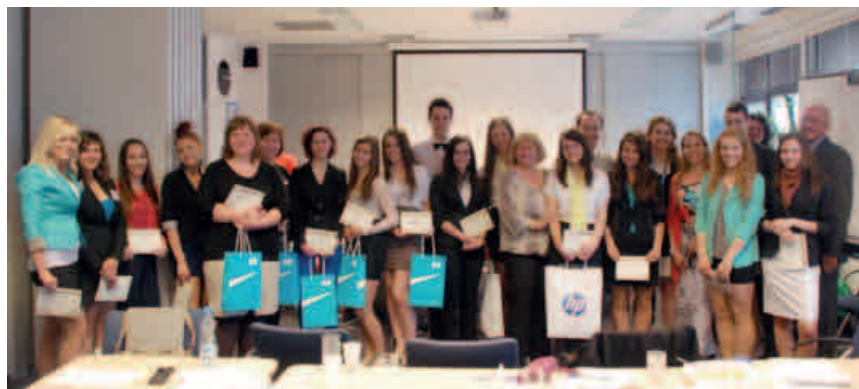
HP prebúdzá záujem mladých ľudí o etický prístup.

Podstatou projektu Globálny etický program – Etika v podnikaní , ktorý sa uskutočňuje pod záštitou organizácie Junior Achievement Slovensko, je pútavým obsahom i formou prebúdzat aktívny záujem mladých ľudí o vnímanie etických hodnôt a chápanie a rešpektovanie odlišností. Cieľom tiež je naučiť ich aplikovať etické rozhodovanie v každodennom živote ako aj neskôr vo vlastnej podnikateľskej praxi.