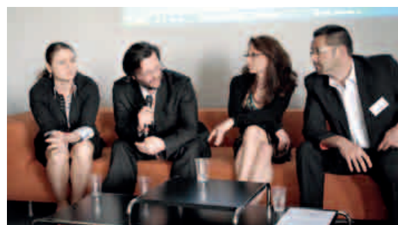
Predstavitelia členských firiem BLF diskutovali o podpore boja proti korupcii.