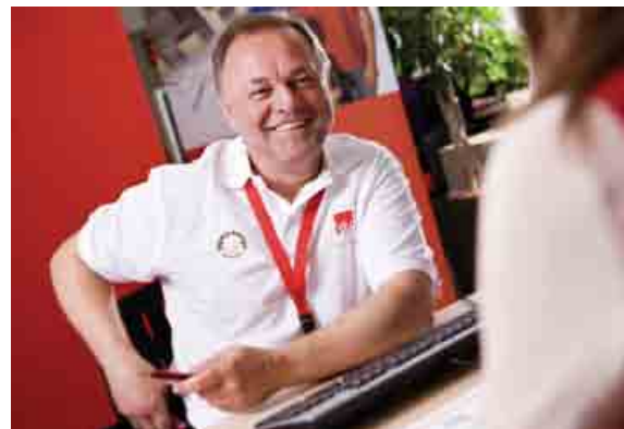
Energetickí poradcovia ZSE poradia, ako ušetriť.