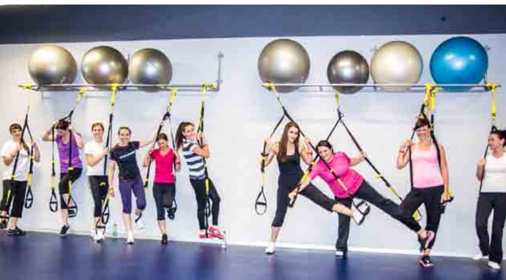
Týždeň zdravia v T-Systems Slovakia aktívne využilo viac než 500 zamestnancov.

Týždeň zdravia však nebol len o starostlivosti o vlastné zdravie, ale aj o pomoci druhým. Zamestnanci darovali 14,5 litra krvi v mobilnej transfúznei stanici priamo v sídle T-Systems Slovakia. «