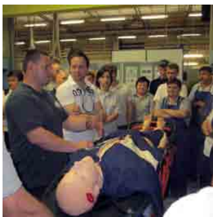
Embraco Slovakia zorganizovalo Deň bezpečnosti, zdravia a životného prostredia pre svojich zamestnancov.